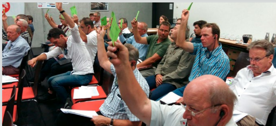
Les délégués ont voté sur les affaires courantes.